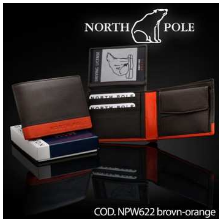
North Pole cod. NPW622 brown-orange. Prezzo al pubblico € 24,90

Portafogli uomo in pelle, multi scomparti e porta spiccioli. Dimensioni da chiuso cm 12,5, x 10