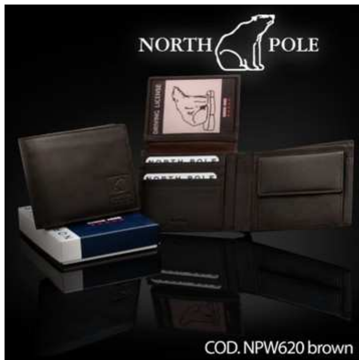
North Pole cod. NPW620 brown. Prezzo al pubblico €24,90